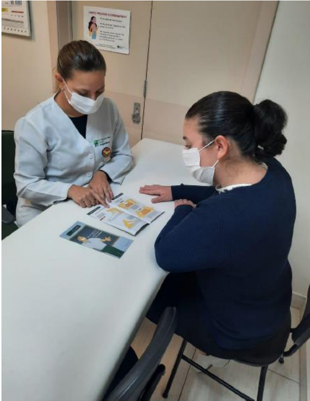
Figura 1 Imagem ilustrativa atendimento da Fisioterapia