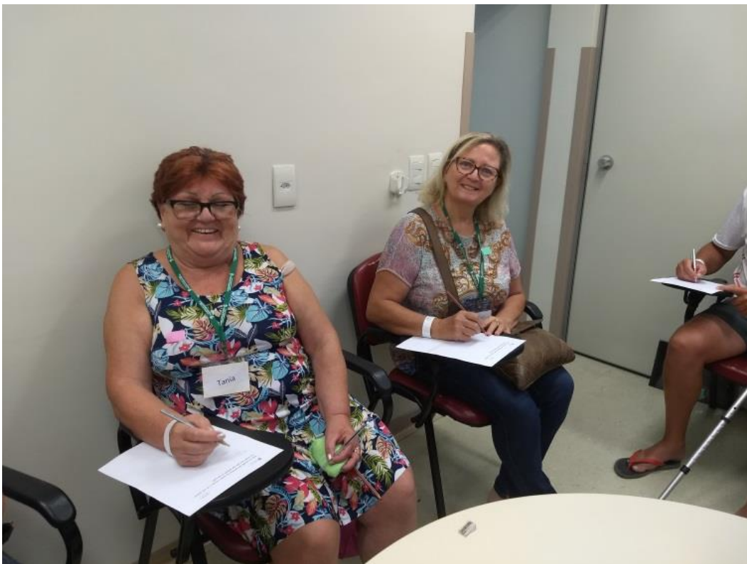
Figura 10 Pacientes do Programa Sem Dor realizando atividades em atendimento de grupo

OBS.: Foto tirada antes da pandemia do covid-19.