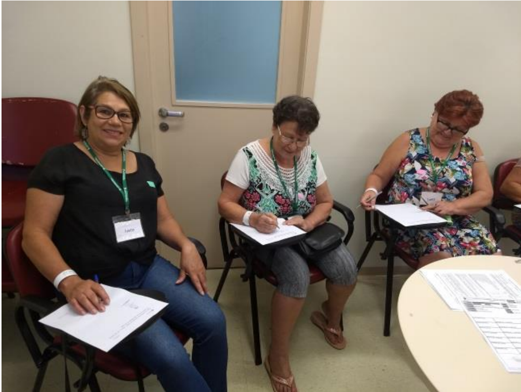
Figura 9 Pacientes do Programa Sem Dor realizando atividades em atendimento de grupo

OBS.: Foto tirada antes da pandemia do covid-19.