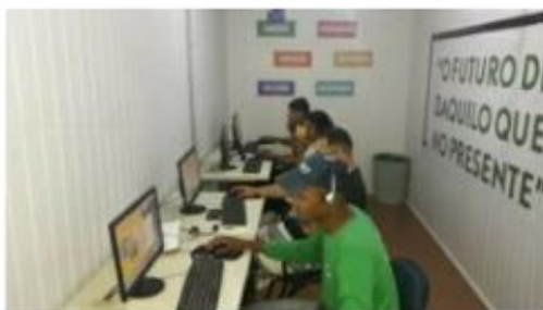
Foto: estagiários realizaram o treinamento no Espaço do Inclusão Digital

Estagiários da Fazenda Parceiro (BA) realizaram treinamento sobre o Código de Ética e Conduta da SLC Agrícola, Nosso Jeito de Ser e NR 31, no Espaço de Inclusão Digital da Unidade. O local oportuniza que todos os colaboradores tenham acesso a tecnologia e a treinamentos via EAD.