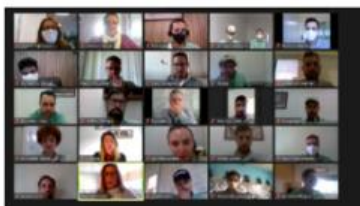
Foto: Déa Machado, realizando a abertura do Módulo Gestão de Pessoas.

Durante a atividade, os participantes puderam assistir apresentações sobre o Programa Trainee, Academia de Líderes, Gestão de Performance, Carreira, Política de Remuneração, Recrutamento e Seleção, Relações Trabalhistas, Comunicação, SGI e Responsabilidade Social e receberam conteúdos importantes para atuação do gestor na liderança de suas equipes.