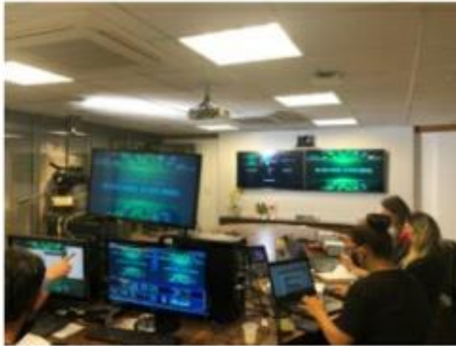
Foto: estúdio montado para a transmissão online dos conteúdos.