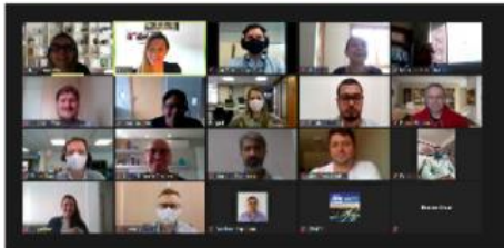
Turma 1 reunida no treinamento

O primeiro módulo do Programa, Liderando a Si Mesmo, ocorreu em 2019 e o último módulo, Liderando Equipes, está previsto para 2021.