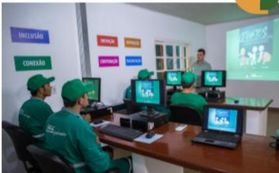
Espaços de Inclusão Digital permitem acesso aos cursos EAD (registro realizado antes da pandemia)

A educação é um dos fatores que mais impacta o crescimento das empresas na atualidade. Por isso, é importante estar sempre disposto a aprender. As empresas do Grupo SLC investem na capacitação dos seus colaboradores nas mais variadas temáticas.