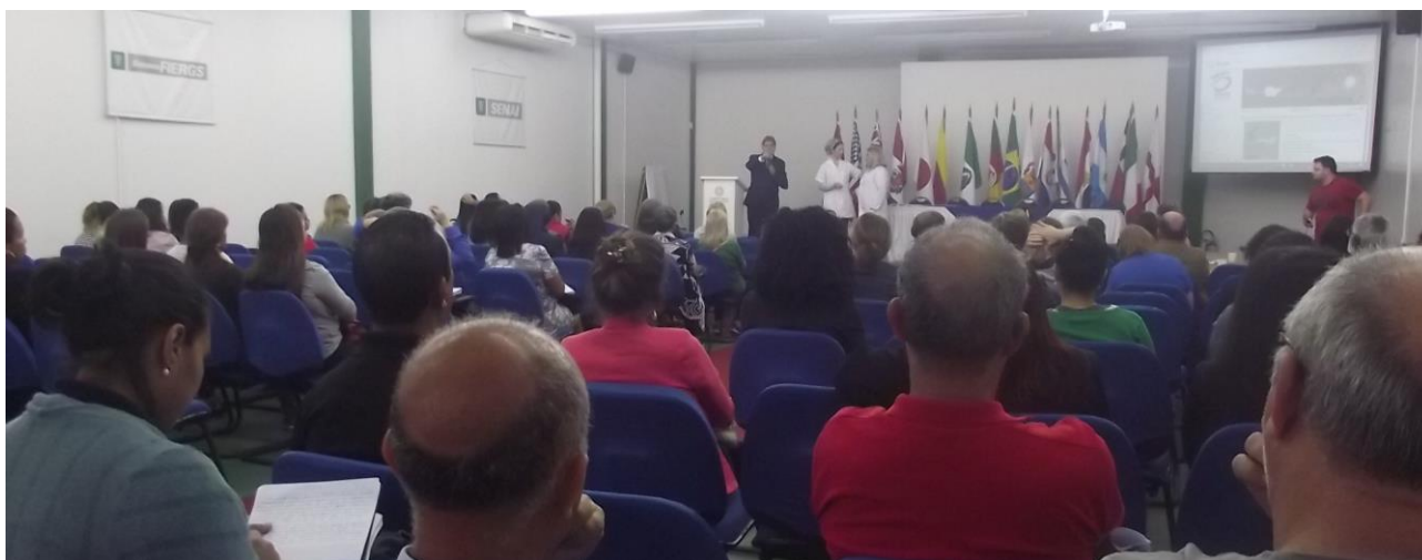
Figura 4 – Reunião de Qualidade com as entidades beneficiadas

Um dos momentos de maior articulação entre as os Bancos Sociais e as entidades beneficiadas ou artesãos se dá nas Reuniões de Qualidade (Figura 5), realizadas trimestralmente. Além de momentos de entrosamento, trocas de experiências com as entidades e artesãos (e trocas de experiência entre os participantes), os representantes das instituições beneficentes podem avaliar os processos de trabalho da Fundação, ajudar a construir novas propostas, expor as suas opiniões e construir juntos essa iniciativa da sociedade .