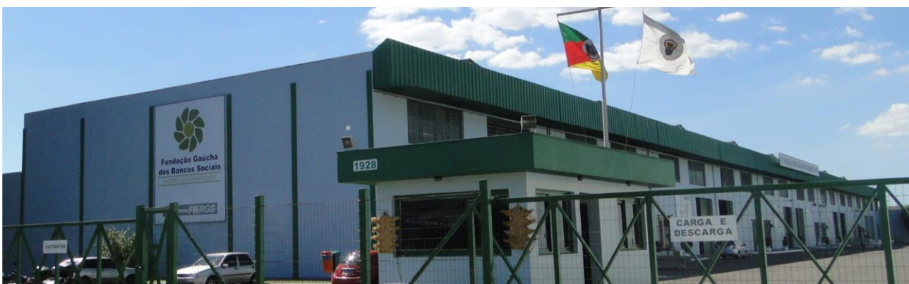
Figura 1 – Fachada da Fundação Gaúcha dos Bancos Sociais da FIERGS

Nas instalações são selecionadas as doações, registradas no estoque, armazenadas e disponibilizadas para distribuição aos artesãos e entidades. No local ainda ocorrem cursos oferecidos gratuitamente à população