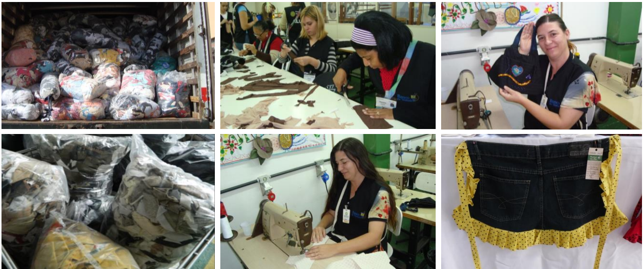
Figura 7 – Resíduos têxteis recebidos são transformados em produtos por artesãos

A Fundação Gaúcha dos Bancos Sociais da FIERGS busca ampliar o projeto do Banco de Vestuários, pois a metodologia é facilmente replicável em outras localidades brasileiras. O Banco de Vestuários recebe constantemente visitas de representantes das Federações de Indústrias do País e integrantes de toda a sociedade, com o objetivo de multiplicar o projeto em outras regiões.