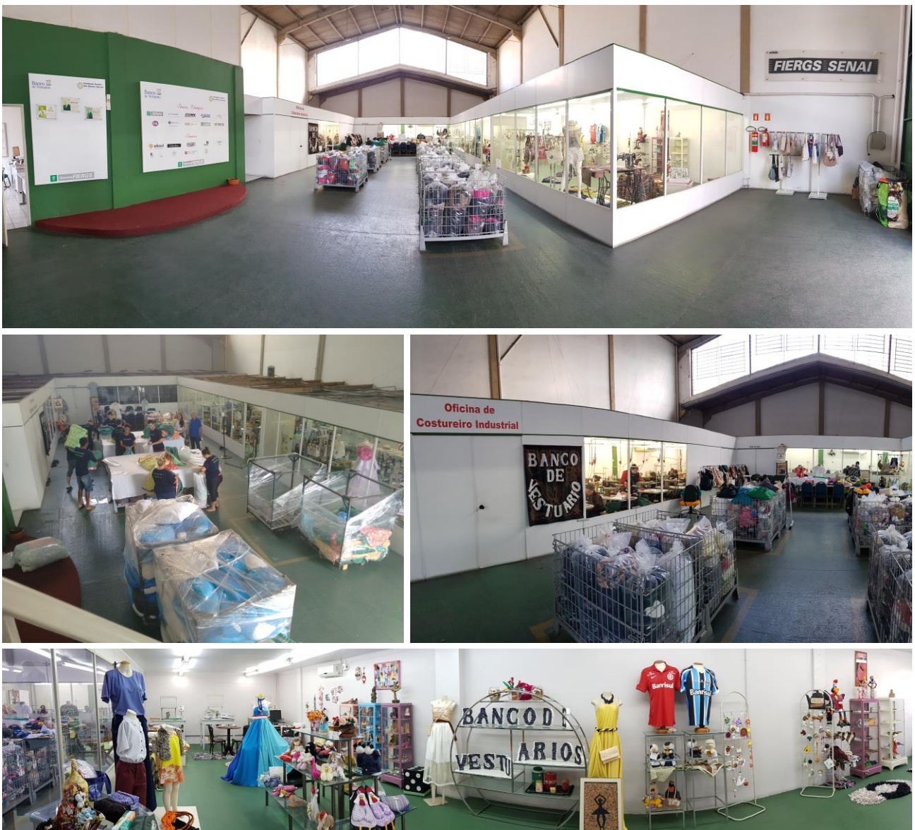
Figura 3 – Imagens internas do Banco de Vestuários

O Banco de Vestuários parte de um bem estruturado plano de ação , com a criação de um Banco de Dados (Enterprise Resource Planning-ERP) que lhe permite identificar a real situação dos artesãos e entidades carentes de Porto Alegre e Rio Grande do Sul, e por via de consequência, de suas principais demandas, oferecendo excedentes industriais, doando produtos e proporcionando cursos de capacitação e introduzindo as técnicas de gestão empresarial no Terceiro Setor na busca da sustentabilidade.